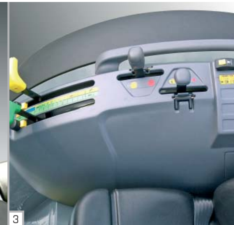
1 - Instrumententafel: rationell, mit gut sichtbaren Instrumenten 2 - Getriebeunabhängige Zapfwellenkupplung 3 - Bedienkonsolen